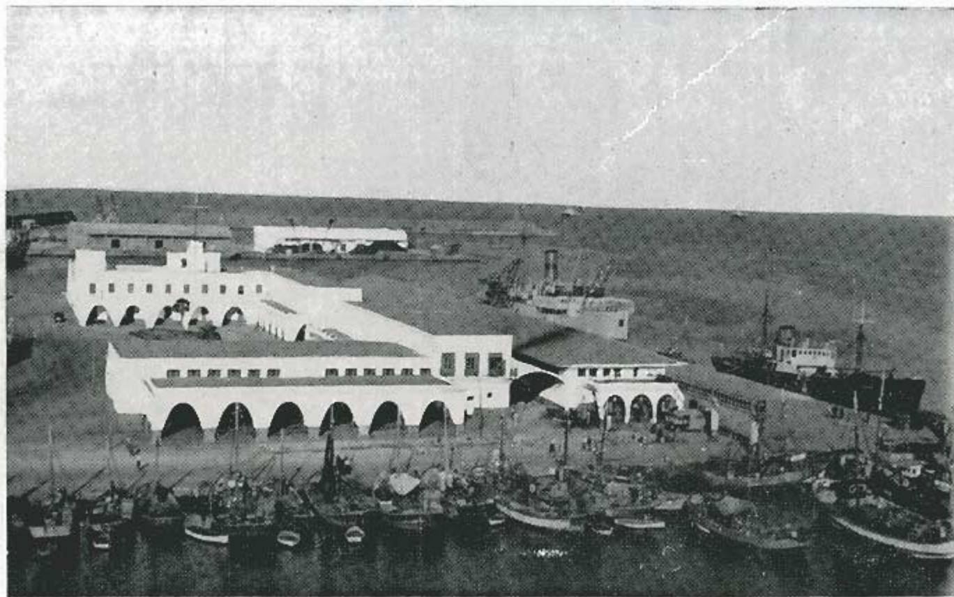
Vista del Puerto de Melilla